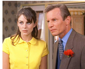
1997 AUSTIN POWERS (Austin Powers, Man of Mystery) de Jay Roach avec Elizabeth Hurley