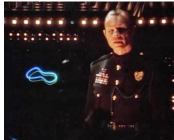
1996 LA PLANÈTE NOIRE (Dark Planet) d'Albert Magnoli