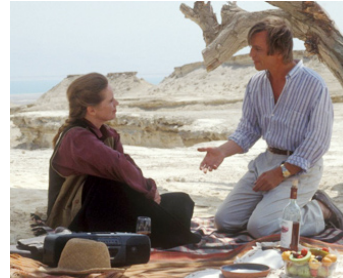
1992 THE LONG SHADOW (A tekozlo apa) de Vilmos Zsigmond avec Liv Ullmann