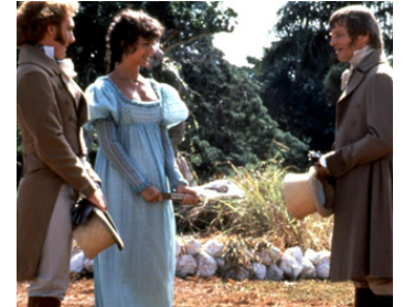
1993 LA PRISONNIÈRE DES SARGASSES (Wide Sargasso Sea) de John Duigan avec Rachel Ward