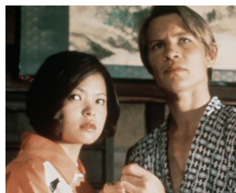
1976 SEPT NUITS AU JAPON (Seven Nights in Japan) de Lewis Gilbert avec Hidemi Aoki