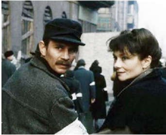
1983 AU NOM DE TOUS LES MIENS de Robert Enrico avec Macha Meryl