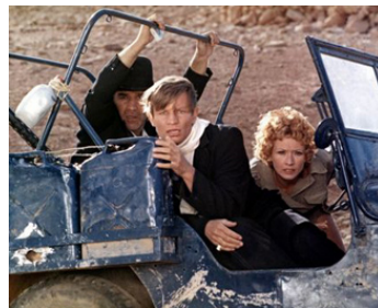
1971 LA POUDRE D'ESCOMPETTE de Philippe De Broca avec Michel Piccoli, Marlène Jobert