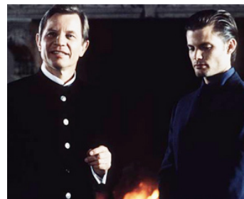
1999 LA PROPHÉTIE DES TÉNÈBRES (The Omega Code) de Robert Marcarelli avec Caspar Van Dien