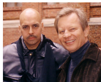
2004 HAUTE TENSION À MOSCOU (Moscow Hedat) de Jeff Celentano avec Robert Madrid