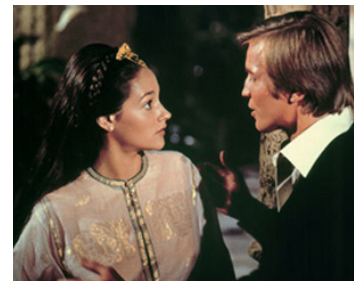
1973 HORIZONS PERDUS (Lost Horizon) de Charles Jarrott avec Olivia Hussey