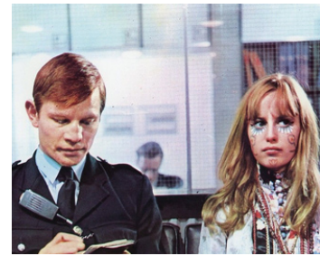
1968 CHANTAGE À LA DROGUE (The Strange Affair) de David Greene avec Susan George