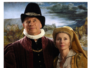
2011 BRUEGEL, LE MOULIN ET LA CROIX de Lech Majewski avec Dorota Lis