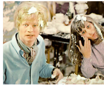
1967 DEUX ANGLAISES EN DÉLIRE (Smashing Time) de Desmond Davis avec Rita Tushingham