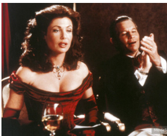
1998 LE DÉTONATEUR (Wrongfully Accused) de Pat Proft avec Kelly LeBrock