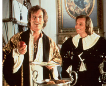
1989 LE RETOUR DES MOUSQUETAIRES de Richard Lester avec Richard Chamberlain