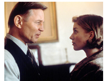
2000 BORSTAL BOY (Borstal Boy) de Peter Sheridan avec Eva Birthistle