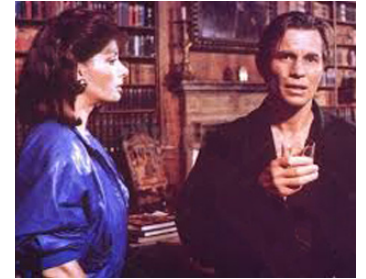
1988 LE TUEUR DE LA PLEINE LUNE (Un Delitto poco comune) de R. Deodato avec Edwige Fenech