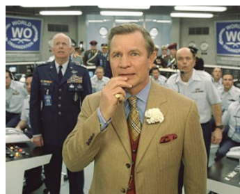
2002 GOLDMEMBER (Austin Powers in Goldmember) de Jay Roach avec Kevin Cooney, Clint Howard