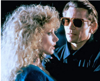
1988 KILLING BLUE (Killing Blue) de Peter Patzak avec Morgan Fairchild