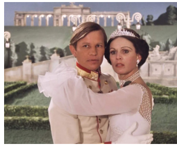
1978 FEDORA (Fedora) de Billy Wilder avec Marthe Keller