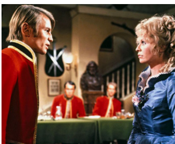
1975 CONDUCT UNBECOMING de Michael Anderson avec Susannah York