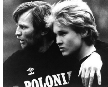
1984 LE SUCCÈS À TOUT PRIX (Success is the best revenge) de J. Skolimowski avec Michael Lyndon