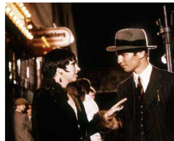
1972 CABARET (Cabaret) de Bob Fosse avec Liza Minnelli