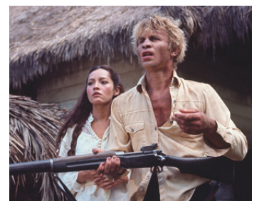
1977 L'ÎLE DU DOCTEUR MOREAU (The Island of Dr Moreau) de Don Taylor avec Barbara Carrera