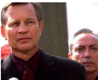
2001 LA PROPHÉTIE DES TÉNÈBRES 2 (Megiddo) de Brian Trenchard-Smith avec Udo Kier