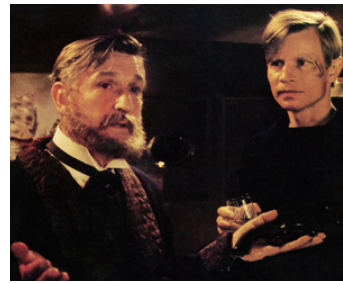
1979 THE RIDDLE OF THE SANDS de Tony Maylam avec Alan Badel