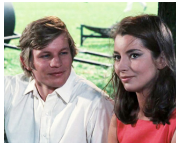
1967 ACCIDENT (Accident) de Joseph Losey avec Jacqueline Sassard