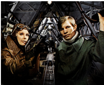
1971 ZEPPELIN (Zeppelin) d'Étienne Périer avec Elke Sommer