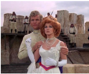
1977 MON «BEAU» LÉGIONNAIRE (Beau Geste) de Martin Feldman avec Ann-Margret