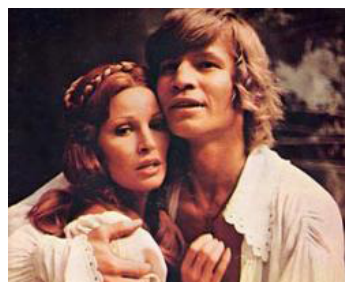
1973 LES TROIS MOUSQUETAIRES (The three Musketeers) de R. Lester avec Raquel Welch