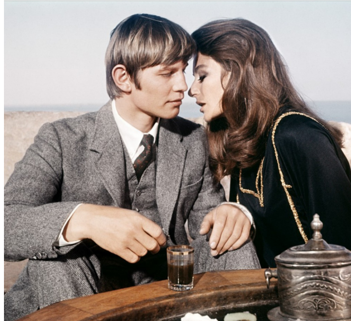
1969 JUSTINE (Justine) de George Cukor avec Anouk Aimée