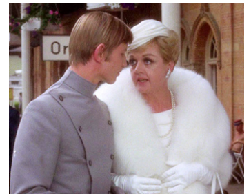
1970 SOMETHING FOR EVERYONE d'Harold Prince avec Angela Lansbury