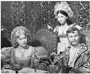
1967 LA MÈGÈRE APPRIVOISÉE (The Taming of the Shrew) de F. Zeffirelli avec Natasha Pyne