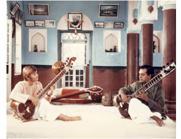
1969 LE GOUROU (The Guru) de James Ivory avec Utpal Dutt