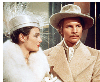
1974 LE CRIME DE L'ORIENT-EXPRESS de Sidney Lumet avec Jacqueline Bisset