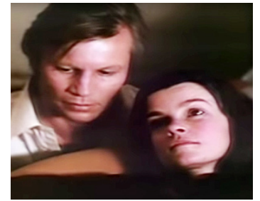
1980 FINAL ASSIGNMENT de Paul Almond avec Geneviève Bujold