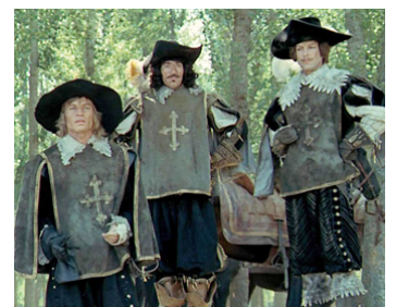
1974 ON L'APPELAIT MILADY (Milady's Revenge) de R. Lester avec Frank Finlay, R. Chamberlain