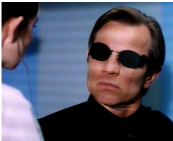
1995 NOT OF THIS EARTH de Terence H. Winkless avec Wendy Buckner