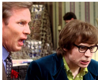
1999 L'ESPION QUI M'A TIRÉE (The Spy who shagged me) de Jay Roach avec Mike Myers